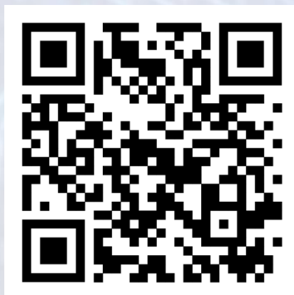
Lantrix Remote Iphone

https://play.google.com/store/apps/details?id=lantrixRemote.alarmas.lantrixalarmas