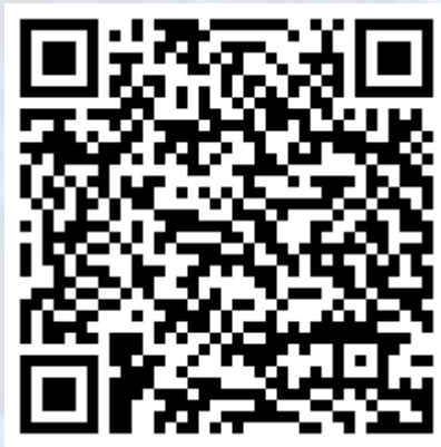
Lantrix Remote Android

https://play.google.com/store/apps/details?id=com.lantrix.lantrixconfig