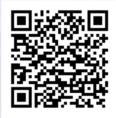
Lantrix Config Android

https://play.google.com/store/apps/details?id=com.lantrix.lantrixconfig